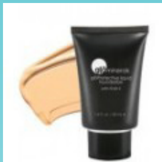
Protective Liquid Foundation 425 kr.

Prisliste - make-up fra Glominerals. Eksempler på produkter og priser. For yderligere information kontakt Gitte Mølbak info@stylesafe.dk eller 61621410