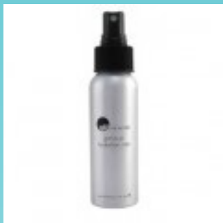
Moist Hydration Mist 235 kr.