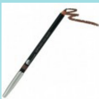
Eyeliner 135 kr.