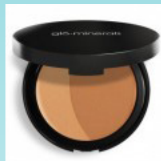
Bronze - sunkiss 425 kr.