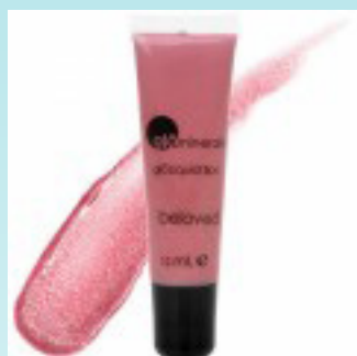
Glominerals Liquid Gloss 175 kr.