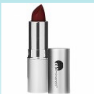
Glominerals Lip Stick 175 kr.