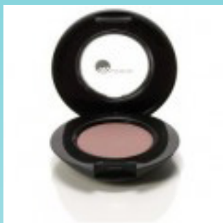
Single øjenskygger 185 kr.