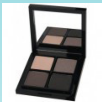
Smokey eye kit 375 kr.