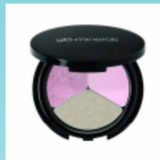
Trio øjenskygger 275 kr.